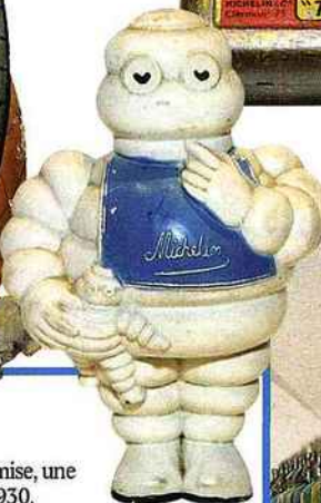
Poupée Michelin de la fin des années 1930, en caoutchouc, avec son baigneur, H. 17 cm.