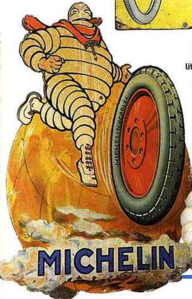
Boîte des années 1930, en tôle lithographiée. Pour Michelin Thymus rustines. L. 9 cm.