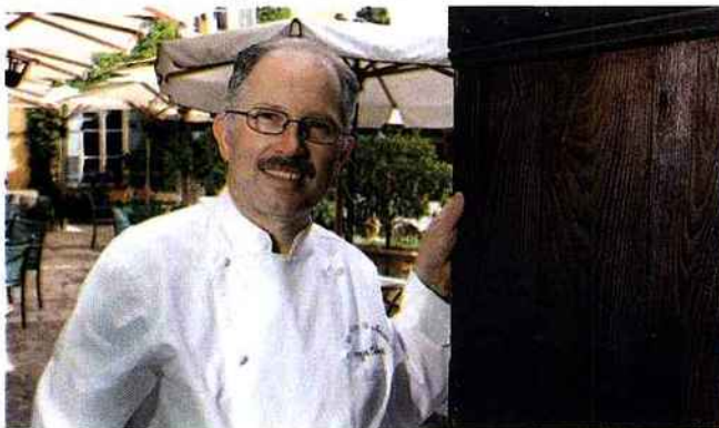
DIOROT / ANOUPA

Quand on veut être à la mode, on a toujours un train