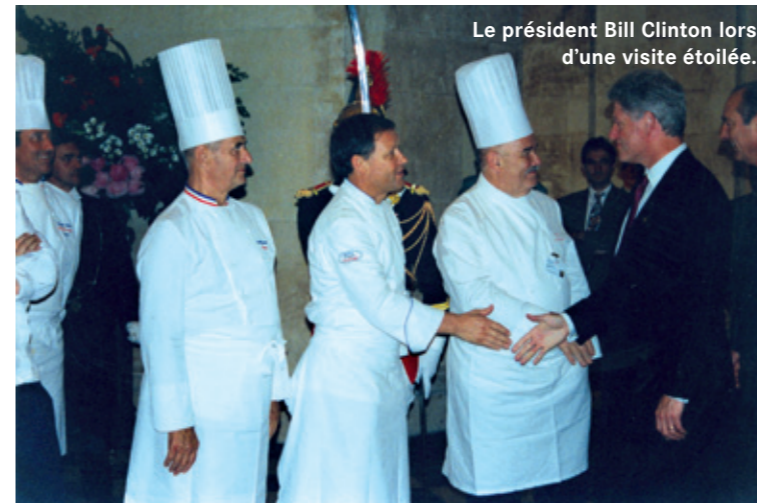
Le président Bill Clinton lors d'une visite étoilée.

Guidé par la passion, hyperactif dans le sens noble du terme, plein d'idées et de projets, « Le Chef » ne s'est jamais contenté de composer des hymnes à la gastronomie. Véritable entrepreneur, il a vite compris qu'un restaurant, fût-il excellent et de renommée, devait s'intégrer dans un concept épicurien bien plus large. « Tout a commencé lors d'une rencontre avec Raymond Loewy, le père de l'esthétique industrielle. Il avait fait la guerre de 14, était devenu citoyen américain, avait travaillé pour des marques comme Coca-Cola, les cigarettes Lucky Strike ou la Nasa. Il avait même fait la déco de l'avion Air Force One. Il m'a