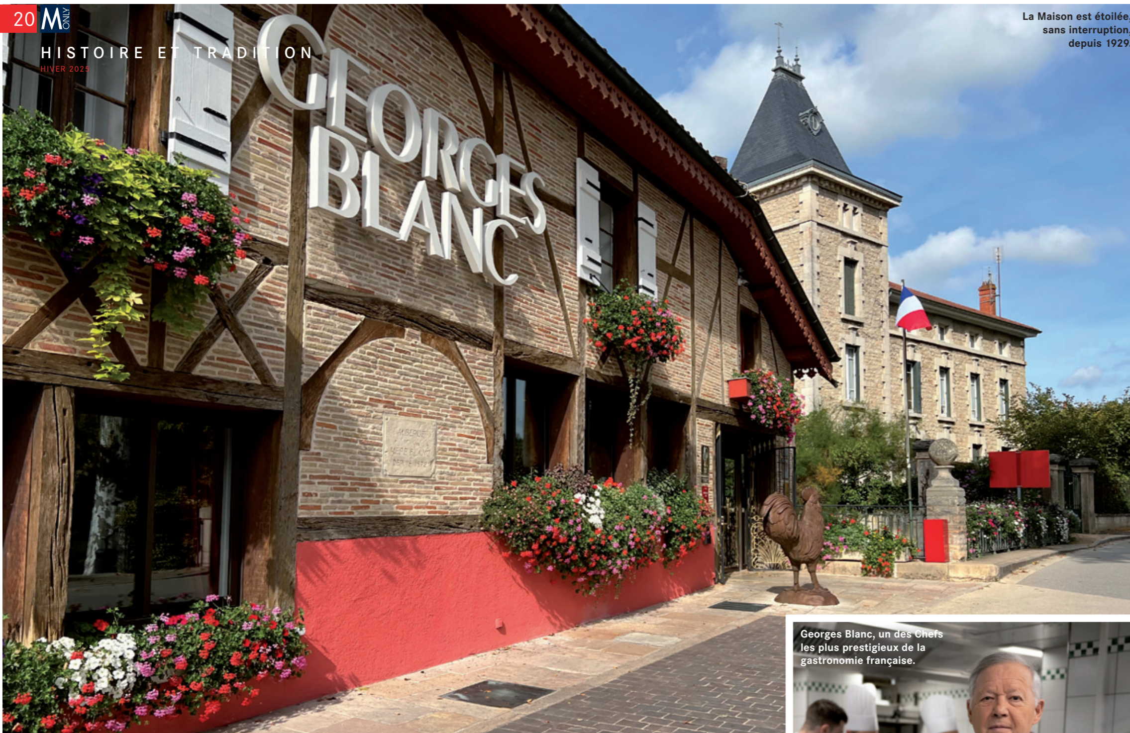
Georges Blanc, un des Chefs les plus prestigieux de la gastronomie française.