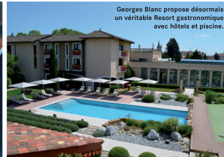
Georges Blanc propose désormais un véritable Resort gastronomique avec hôtels et piscine.