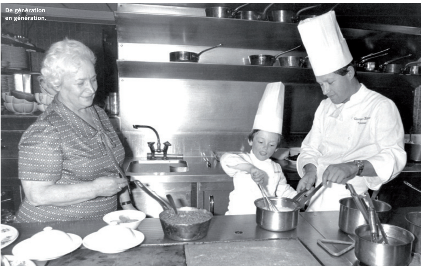
De génération en génération.

d'autres régions voisines avec, pêle-mêle, des restaurants, des brasseries, des hôtels ou des épiceries fines. Avec partout le même ADN et la même envie d'excellence. « Le Chef », fin œnologue, a même acheté son propre vignoble.