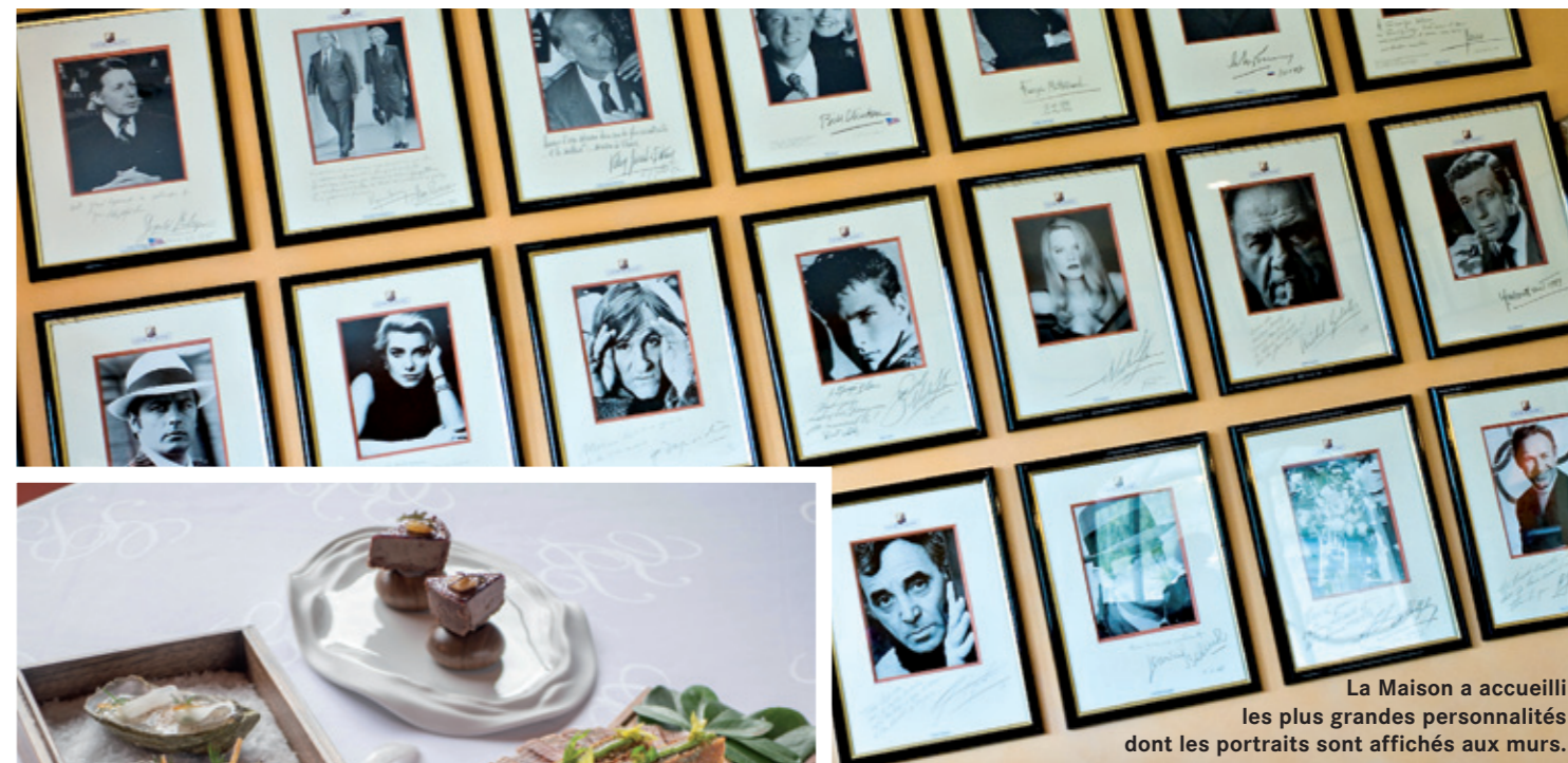
La Maison a accueilli les plus grandes personnalités dont les portraits sont affichés aux murs.