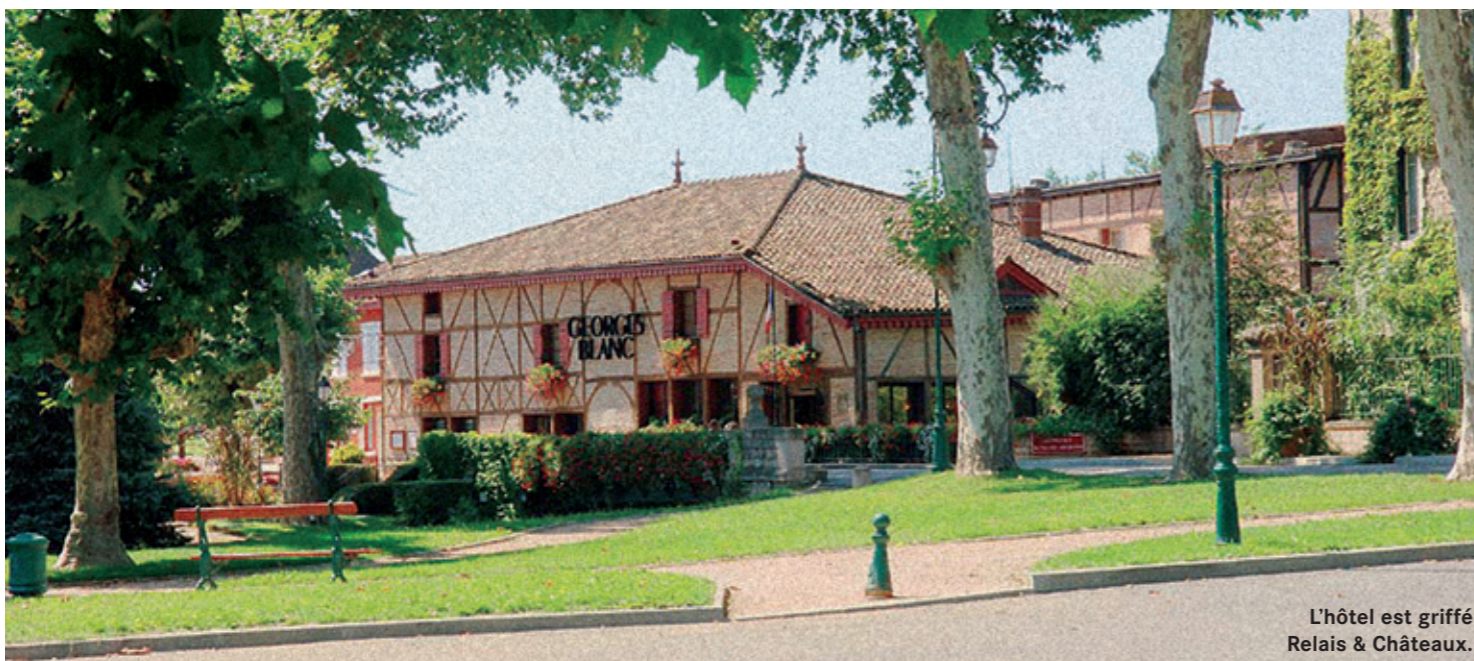
L'hôtel est griffé Relais & Châteaux.